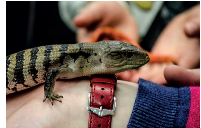
Tiere kennen lernen