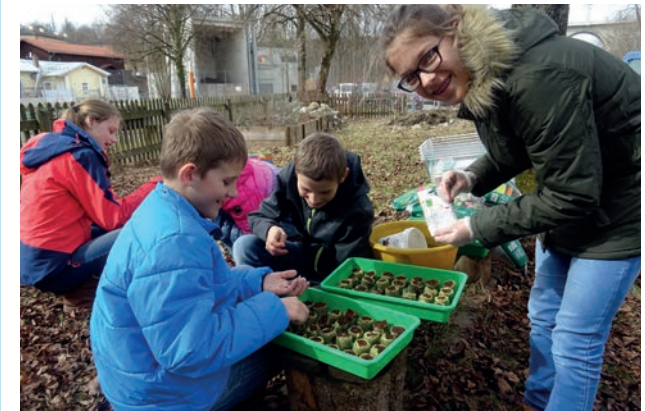
Freilandbiologie im Schulgarten